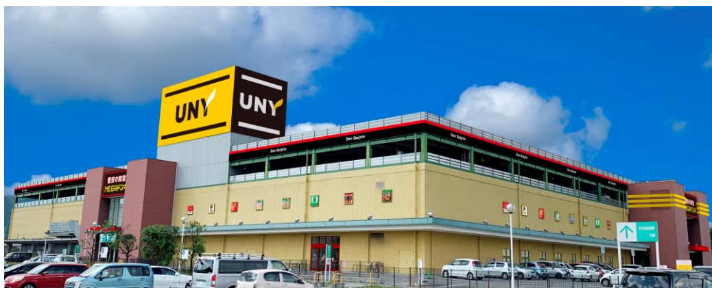
「MEGAドン・キホーテUNY石和店」外観

当社は2018年より「アピタ」「ピアゴ」を、「ドン・キホーテ」が持つ時間消費型の店舗作りと「ユニー」のノウハウが有機的に結合するダブルネーム店舗へ業態転換を進めています。今回、「アピタ石和店」を「MEGAドン・キホーテUNY石和店」としてリニューアルオープンし、両社の強みを活かした豊富な品揃えと、エンターテインメント性あふれる店舗演出で、地域の皆さまに末永くご愛顧いただける店づくりを目指してまいります。