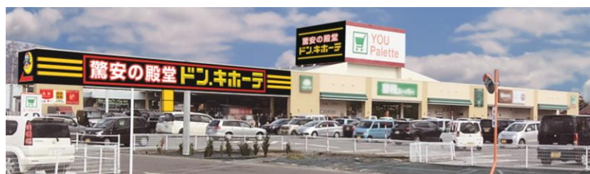
「ドン・キホーテ信州中野店」外観イメージ

株式会社ドン・キホーテ（本社：東京都目黒区、代表取締役社長：吉田直樹）は、2020年12月18日（金）に、長野県中野市に所在する高井富士ショッピングセンター内に、「ドン・キホーテ信州中野店」をオープンします。