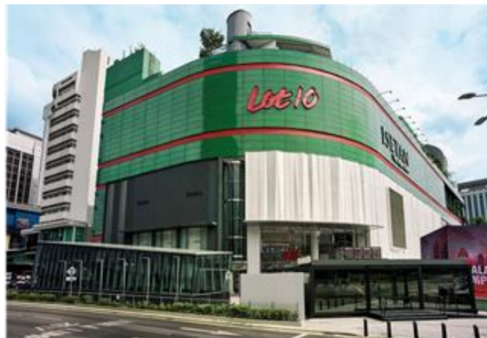
2021 年初頭出店予定施設「LOT10」外観