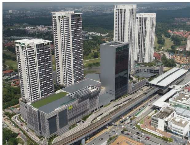
2021 年半ば出店予定施設「Tropicana Gardens Mall」外観