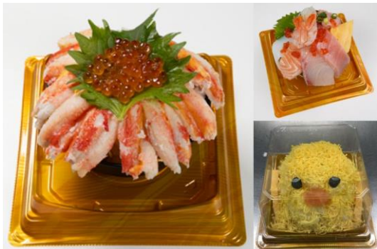
見て楽しい・食べて美味しい「魅せ丼」各種

鮮魚コーナーでは、北海道で水揚げされた定番の寿司・海鮮丼だけでなく、見て楽しい・食べて美味しい「魅せ丼」などドンキ独自のユニークな海鮮商品を提供します。シニア世帯も食べやすいサイズのミニ丼ぶりをはじめ韓国風のオリジナル創作丼ぶりなども種類豊富に用意しています。