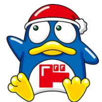
ドンペン。シンガポールにおいても「Donpen」と呼ばれ親しまれている

このたび出店するエリア「Punggol」は、公営住宅(HDB)の建設が近年増加しており、「Waterway Point」の周辺には遊歩道やレジャー施設があり、ファミリー層が多く訪れます。このたびオープンする「DON DON DONKI Waterway Point」は、当社のマスコットキャラクター、ドンペンモチーフにした「ドンペンパーク」というコンセプトを設け、アミューズメント感のある店内装飾を施し、ワクワク・ドキドキを感じられる空間を創造します。