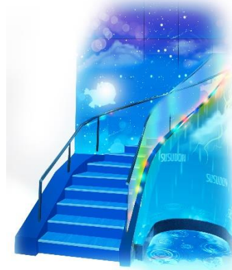
▲ナイトマーケットをイメージした店内階段▲

同店がオープンする北海道札幌市のすすきのは、駅が近いことや、飲食店・宿泊施設・娯楽施設・商業施設が隣接する環境から、さまざまな業種が集積し、トレンド感が高い地域です。今後は都市再開発による近隣施設の建て替え、インフラ整備も進み、さらに多くの方が行き交うにぎやかなエリアになることが期待できます。