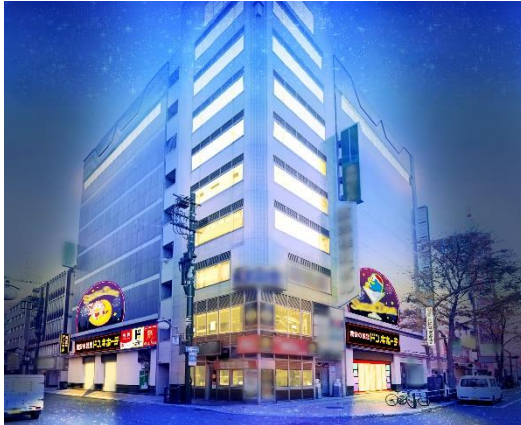
▲ドン・キホーテすすきの 店舗外観イメージ▲